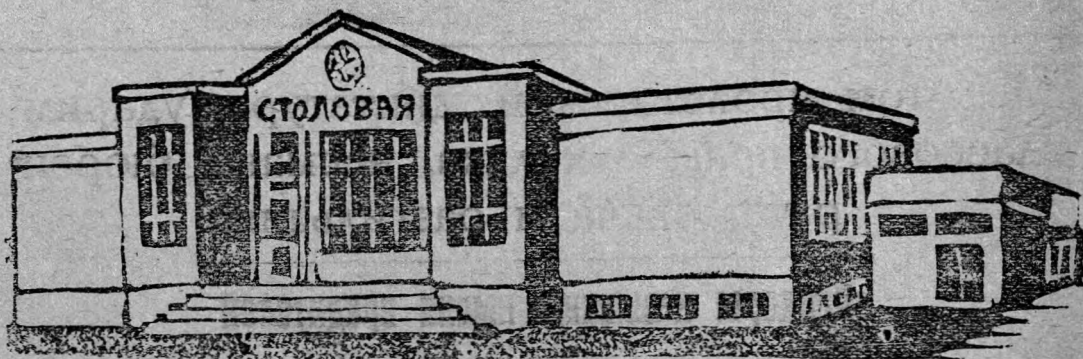
Кооперация все больше и больше вклинивается в быт Лысьвенского рабочего. На нашем рисунке достраивающаяся кооперативная столовая на Революционной улице